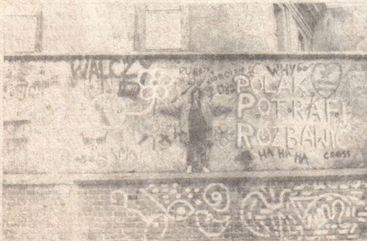
Mur na Tumskim Ostrowiu wymalowany przez Pomarańczową Alternatywę.

Przeprowadzał on wywiady w ramach jednego z programów badawczych IS UW. Po zaproszeniu do cywilnej Nysy został pobity. Po przewiezieniu do WUSW i przesłuchaniu został zwolniony. Magnetofon reporterski został zwrócony po interwencji władz Uniwersytetu Wrocławskiego.