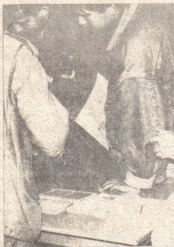
Sprzedaż prasy NZS na Politechnice Warszawskiej

9.11. na Politechnice Wrocławskiej odbył się wiec związany z bojkotem Studium Wojskowego. Wzięło w nim udział ok. 300 osób. Uchwalono rezolucję, w której skrytykowano stanowisko MEN przedstawione w telexie z 4.11. O godz. 21 w akademiku Politechniki odbyła się dawno nie stosowana forma protestu tzw. parapetowa, polegająca na wyłączaniu i włączaniu światła oraz tłuczeniu w parapety.