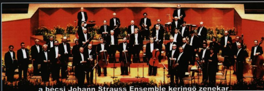
a bécsi Johann Strauss Ensemble keringő zenekar