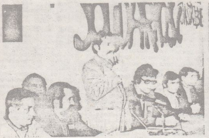
LECH WAŁESA ; JAROSŁAW SIENKIEWICZ w czasie spotkania z MKZ-ami i ZKR-ami w Jastrzębiu Zdroju